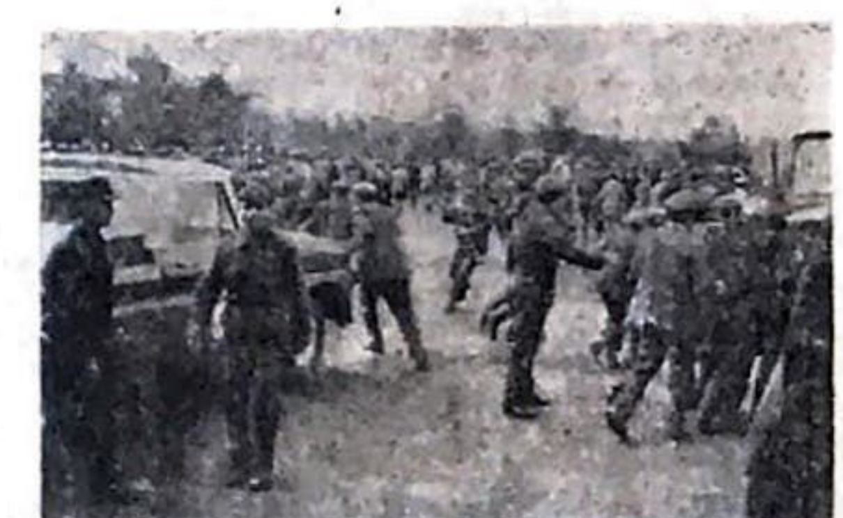
Batman'da jandarma «Açız, iş istiyoruz» diyen işçilere böyle saldırdı.